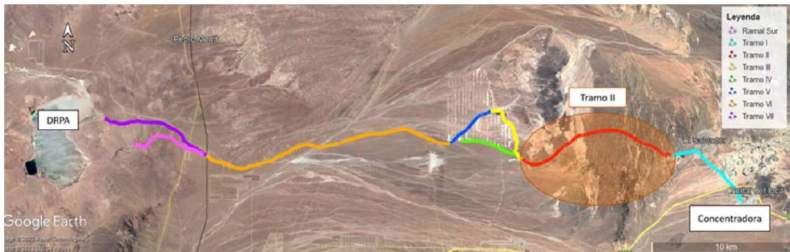
Figura 2-2: Vista general en planta de la canaleta de relaves