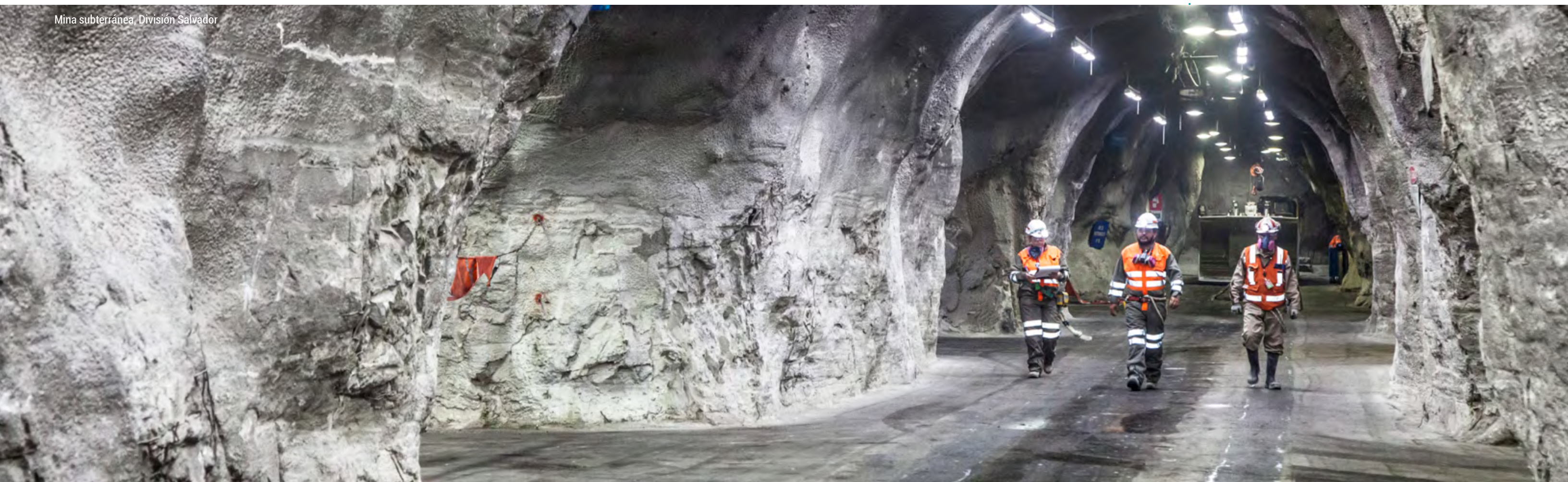
Mina subterránea, División Salvador

Rechazamos todo comportamiento y práctica ilícita, en cualquiera de sus manifestaciones, dado que la corrupción socava la confianza en los negocios y la sociedad, y es incompatible con nuestros valores.