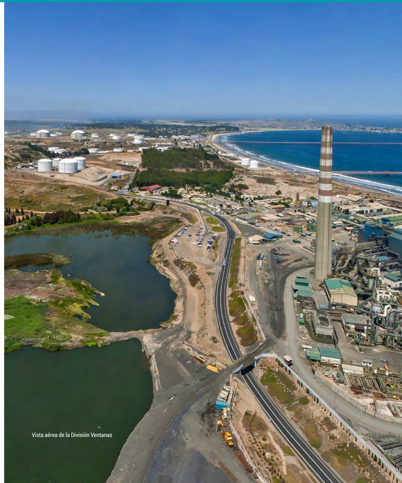
Vista aérea de la División Ventanas