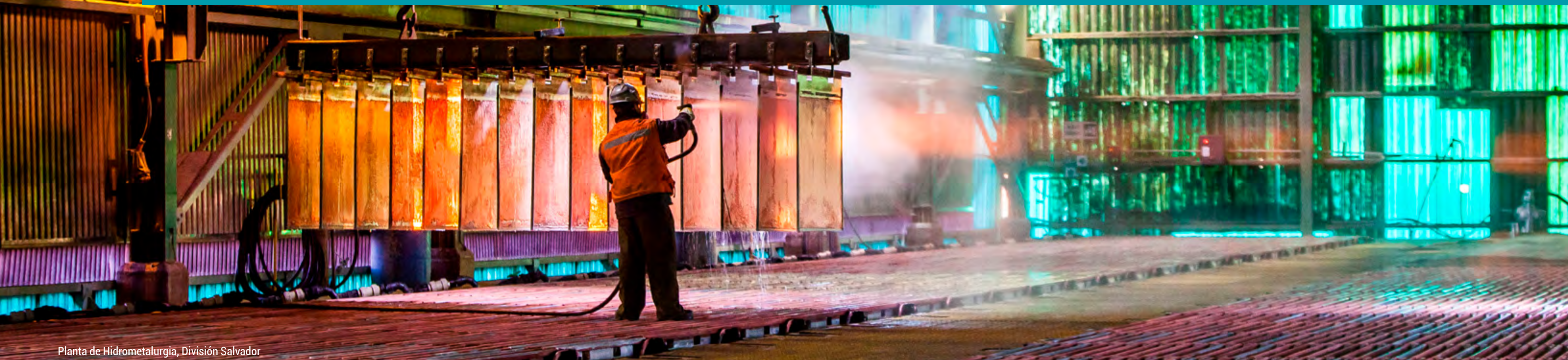
Planta de Hidrometalurgia, División Salvador

Además, por orden del Estado, adquirimos en 2005 la Fundición y Refinería Ventanas, que hasta entonces le pertenecían a la Empresa Nacional de Minería (Enami).