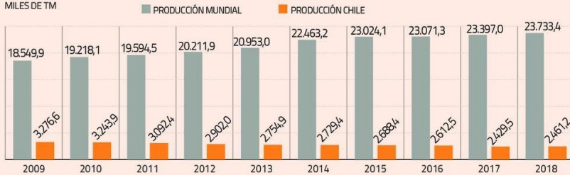
PRODUCCIÓN MUNDIAL Y CHILENA DE COBRE REFINADO