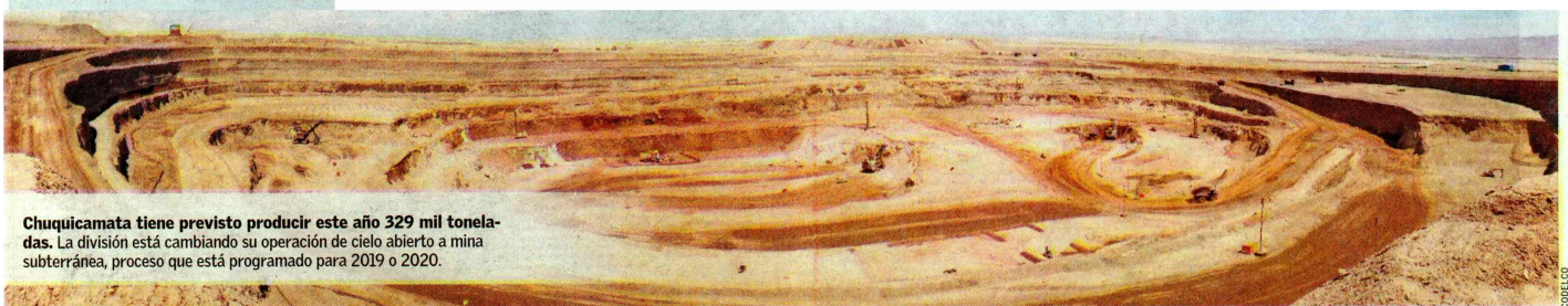
Chuquicamata tiene previsto producir este año 329 mil toneladas. La división está cambiando su operación de cielo abierto a mina subterránea, proceso que está programado para 2019 o 2020.