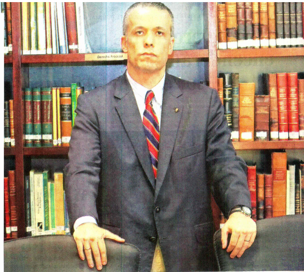
PRESIDENTE DEL DIRECTORIO, ÓSCAR LANDERRETCHÉ, Y EL ATAQUE QUE SUFRIÓ EN SU HOGAR EL 13 DE ENERO

“Yo creo que hay muchas cosas que hemos hecho en Codelco y que son candidatas a haber molestado a alguien”.