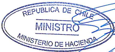
Mario Marcel Cullell Ministro de Hacienda

No habiendo consultas ni otros temas a tratar, y siendo las 10:30 horas, y habiéndose cumplido el objeto de la convocatoria de la presente Reunión, se levantó la sesión, agradeciendo a los asistentes por su presencia.