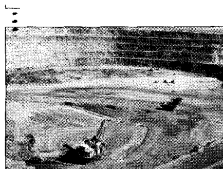
LUZ ROJA.— Sulfolix es uno de los grandes planes mineros para los próximos años.

Consultada Codelco de manera oficial, declinó emitir opiniones al respecto.